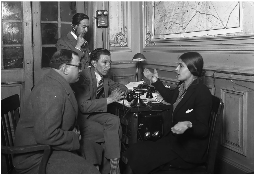
Tina Modotti durante el interrogatorio por las investigaciones de la muerte de Julio Antonio Mella.