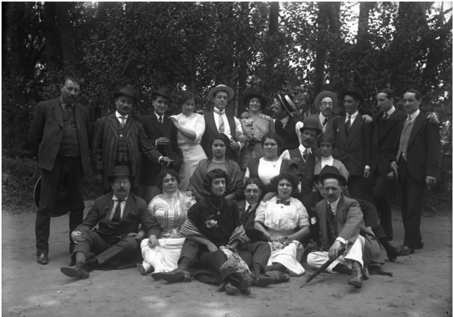
(70642) Hombres con prostitutas en Xochimilco, retrato de grupo, ca. 1920.