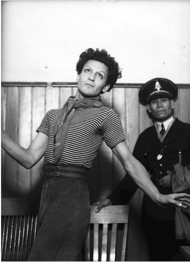
(8491) Homosexual detenido en una comisaría, ca. 1925.