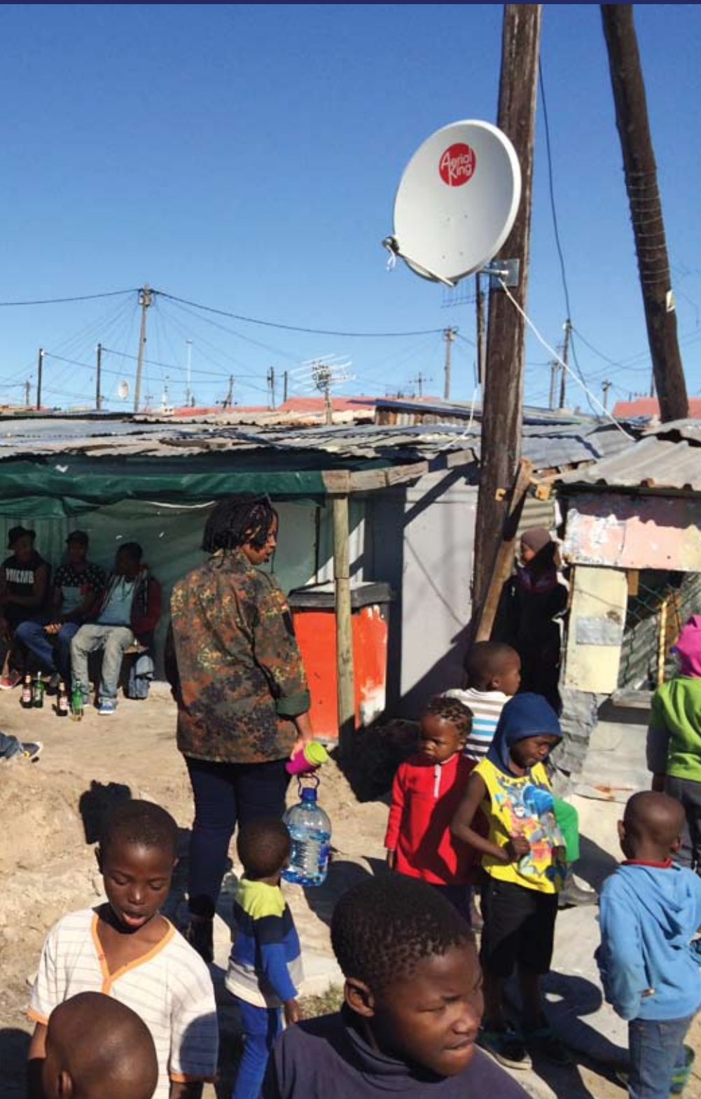
Estudiantes y miembros del movimiento de hip hop Soundz of the South (SOS), Kayelitsha, 2015.