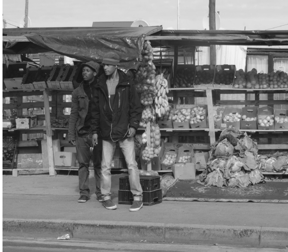
Foto 2. Jóvenes en el mercado de verduras viendo desafiantes a quienes marchamos durante el Khumbulani Pride.

de frutas y verduras donde dos jóvenes de cabeza erguida y desafiante miran la movilización como si estuvieran dispuestos a pelear en cualquier momento (Foto 2).