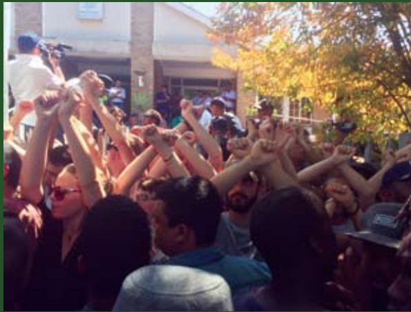
Protestas de estudiantes, 2015. Sentada frente al parlamento (izquierda) y en la Comisaría de Rondebosch.