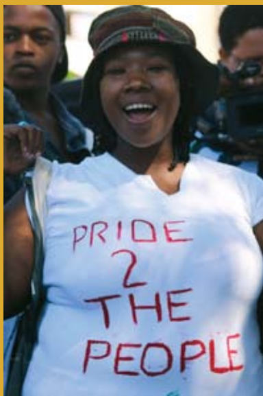
Alternative Inclusive Pride, Ciudad del Cabo, 2014.