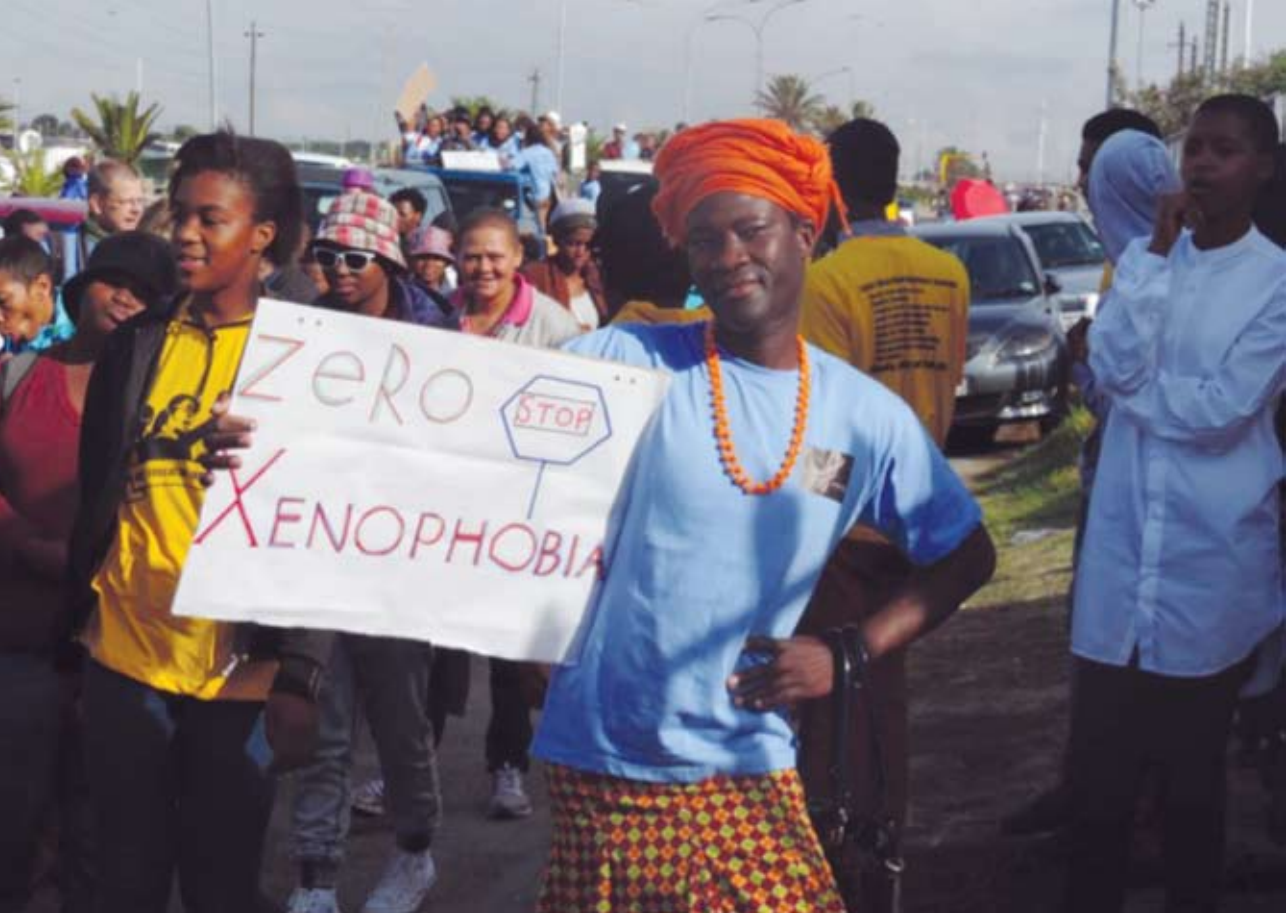
Activista LGBTI, Tiwonge Chimbalanga.