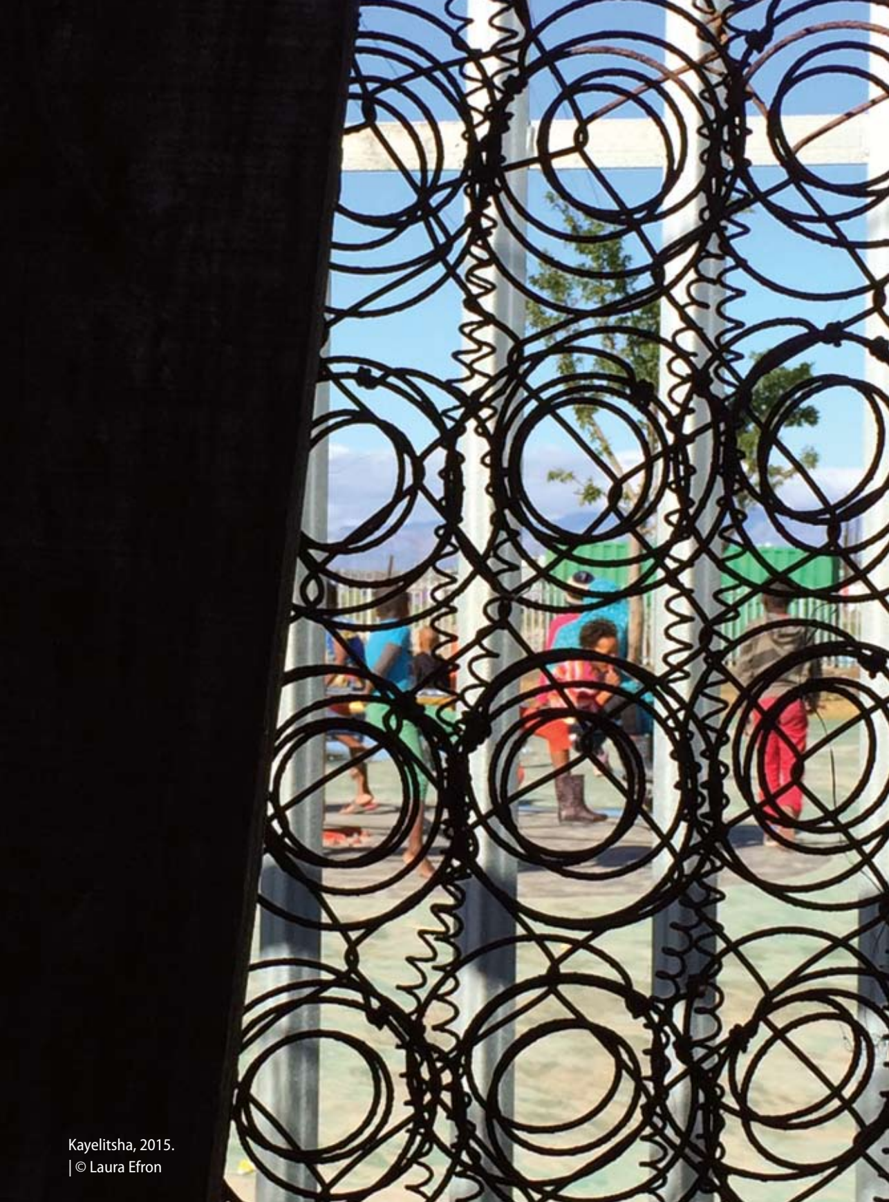
Kayelitsha, 2015.