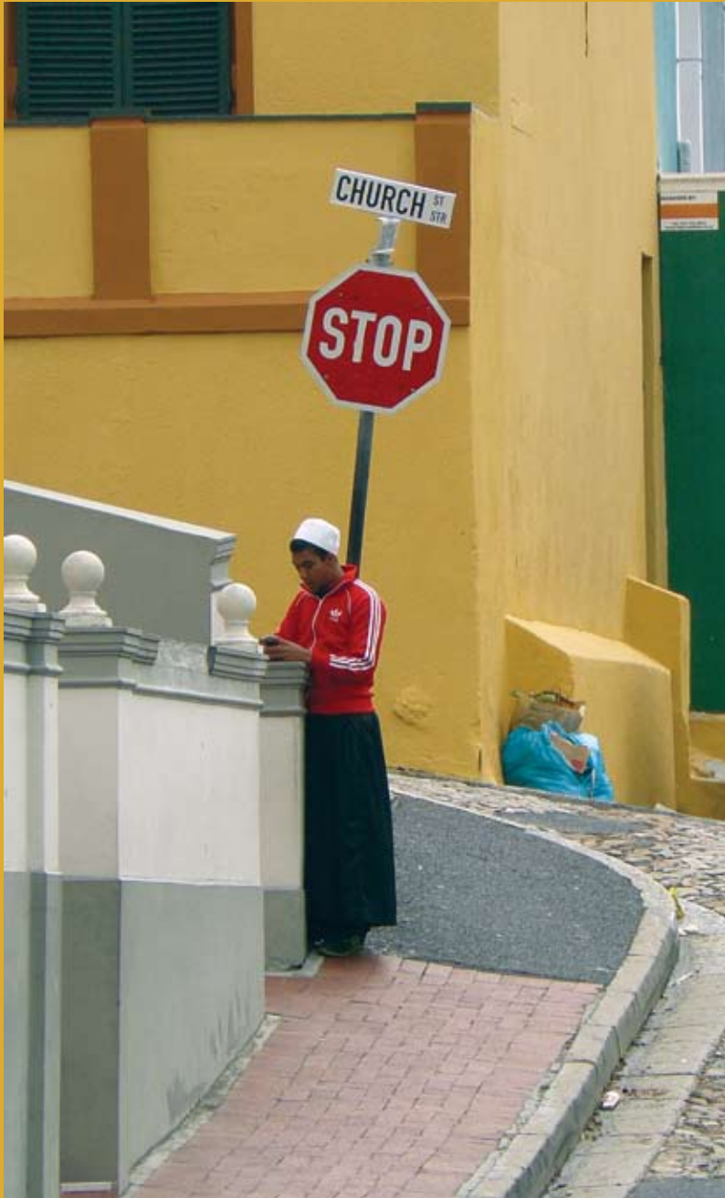
Bo-Kaap, 2013.