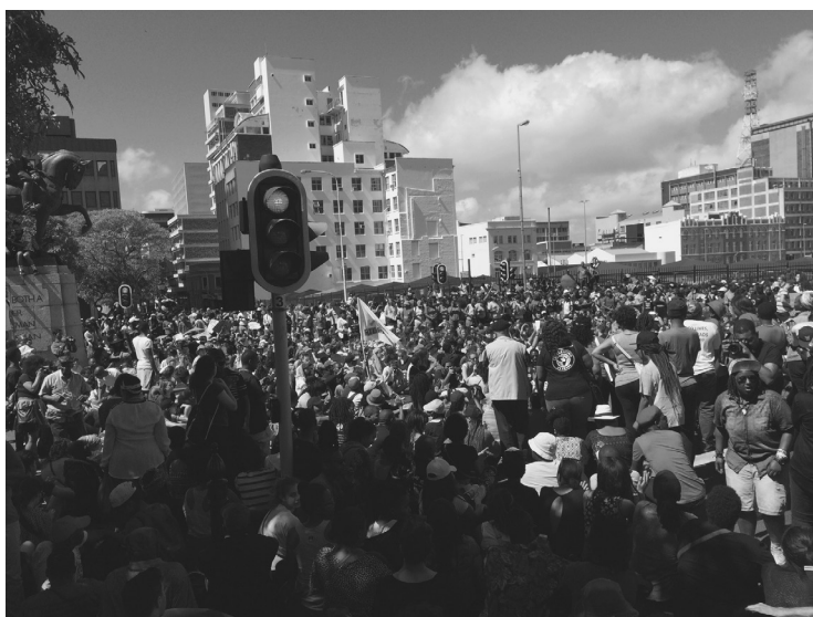
Estudiantes ocupan las calles frente al Parlamento en Ciudad del Cabo. Sentada general (Laura Efron, octubre de 2015).

del espacio público son criticados por algunos adultos, que los juzgan como infantiles, y son celebrados por otros, que encuentran en tales acciones reflejos de sus propias experiencias de protesta (como estudiantes) contra el sistema educativo del apartheid durante las décadas de 1970 y 1980. Los medios de comunicación y las autoridades universitarias presentan imágenes distorsionadas en las que muestran a los jóvenes como violentos e irrespetuosos. 26 Por lo visto, la descolonización de los cuerpos y los espacios sigue en disputa y las prácticas de las y los estudiantes, lo pone en evidencia.