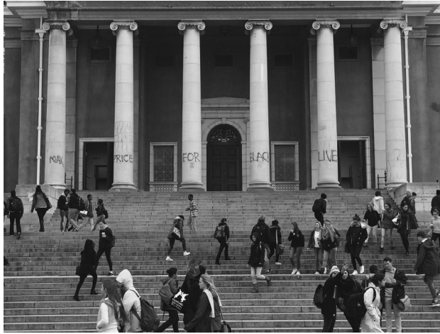
“Max Price for Black Lives” (“Precio máximo para las vidas negras”). Graffiti en las columnas centrales de la UCT que realiza un juego de palabras con el nombre del rector de la universidad, Max Price.