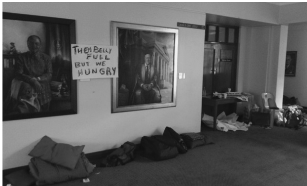
“Sleeping bags line the corridors of the Bremner building”. En el cartel entre los retratos de dos de los ex rectores de la universidad puede leerse “Ellos panza llena, pero nosotros hambrientos” (Herman).