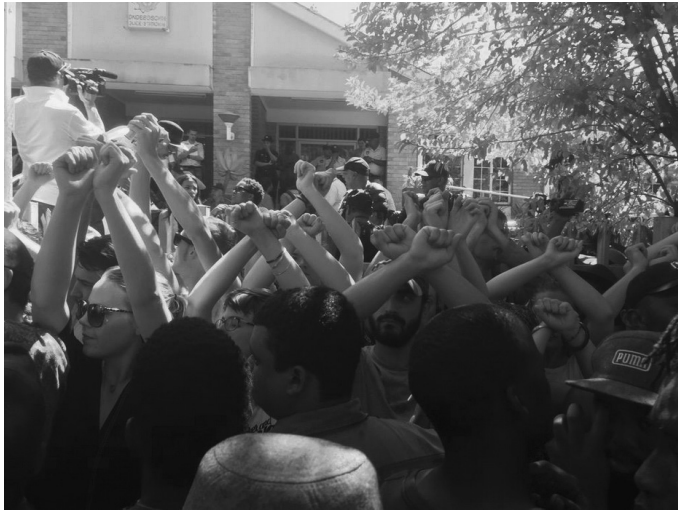
Estudiantes blancos arman una cadena humana para evitar ataques de la policía sobre los estudiantes negros frente a la comisaría de Rondebosch (Twitter, octubre de 2015) [ http://citizen.co.za/827670/uct-protesters-call-for-white-human-shield/ ].

Más allá de tales contradicciones, resulta interesante analizar cómo la condición de clase sí aparece en el discurso estudiantil a la hora de apoyar las demandas de los trabajadores de la universidad. Mientras la condición de clase se pierde dentro del discurso racial del movimiento, sí aparece de modo explícito en el apoyo a los reclamos por los derechos laborales de los trabajadores. La demanda de finalizar con la tercerización de los servicios y la precarización de las condiciones laborales es entendida como una demanda de clase más que de raza. Y si bien la lectura que se hace de las políticas institucionales es acertada, en tanto crítica al neoliberalismo, la redefinición de la relación clase-raza post-apartheid sigue pendiente.