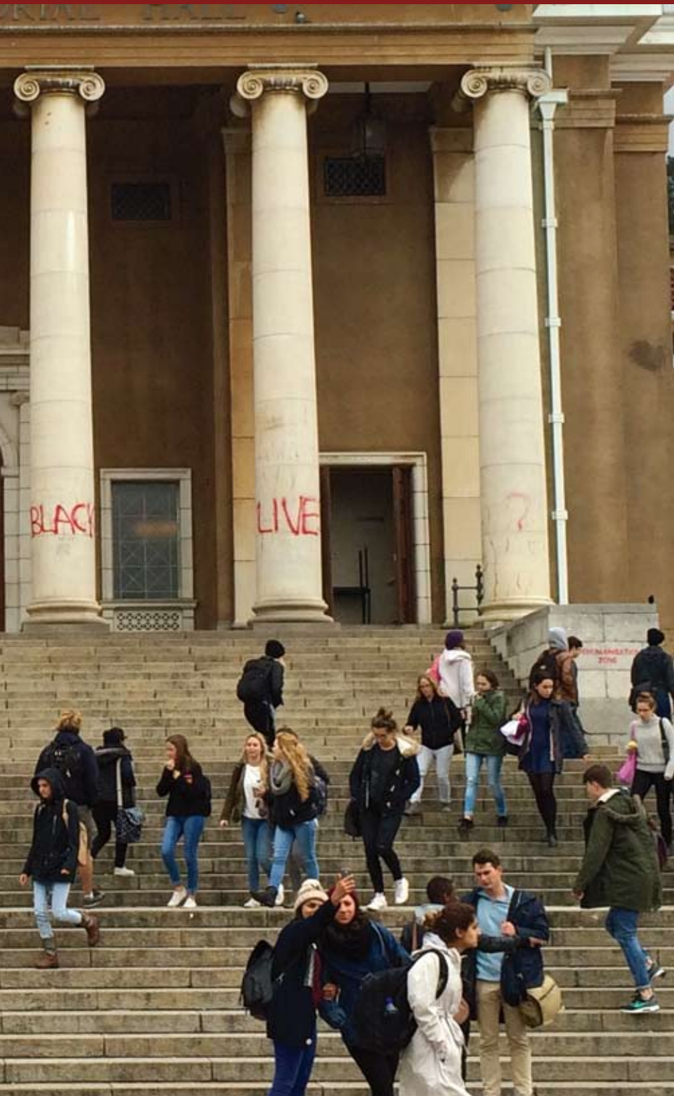
"Max Price for Black Lives". Graffiti pintado durante las protestas de 2015, Jammie Hall UCT.