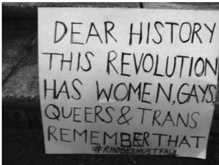
“Querida Historia, esta Revolución tiene mujeres, gays, queers y trans. Recuérdalo”. Cartel usado durante las movilizaciones en la UCT (Facebook. UCT: The Trans Collective, 13 de julio).

lo que aún queda un largo camino por recorrer. Esta es una buena radiografía de las paradojas de una Constitución que promueve igualdades y libertades en un país con una larga historia de mujeres en movimiento y, desde la década de 1990, de sexualidades disidentes también movilizadas, frente a una sociedad que aún pone trabas a una redefinición más incluyente de la categoría de ciudadano/a.