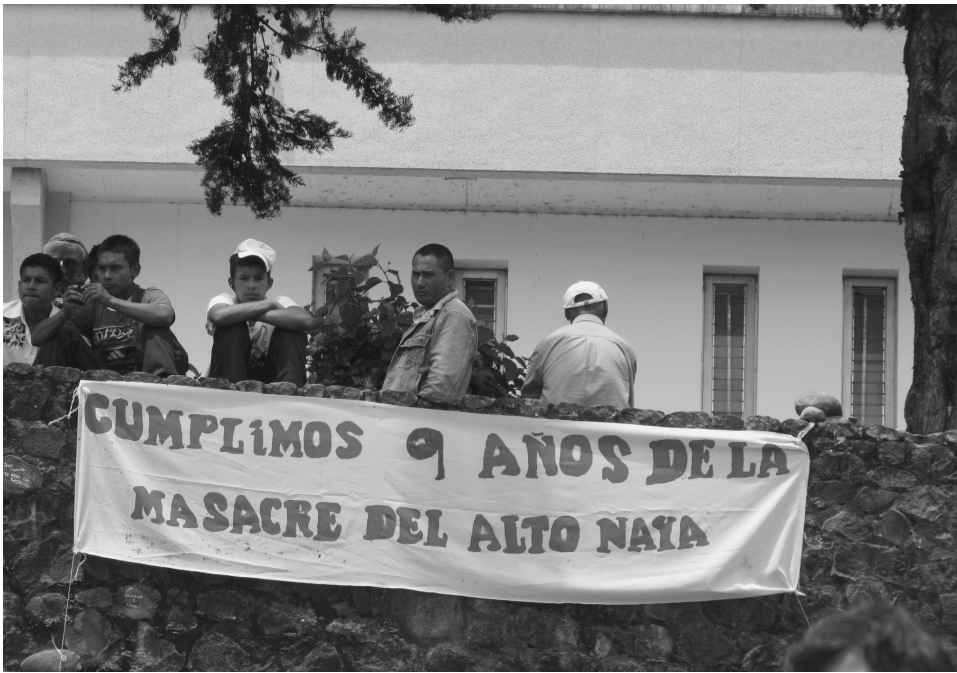
Víctimas de la masacre en la novena conmemoración.