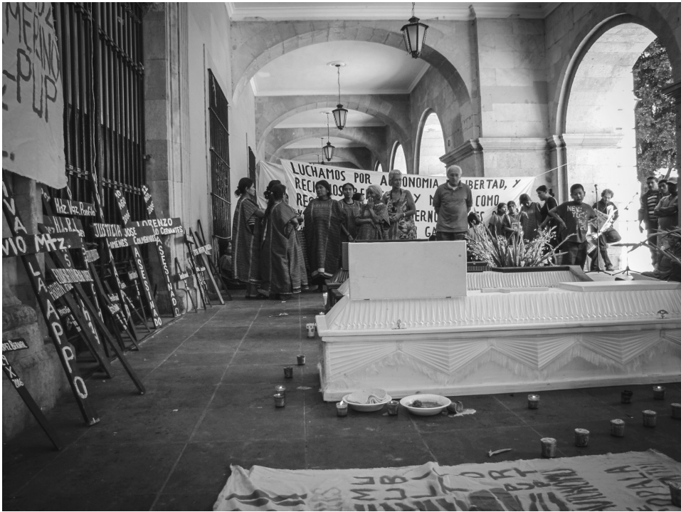
Velorio público de tres hombres asesinados. Palacio de Gobierno, ciudad de Oaxaca, 2011.