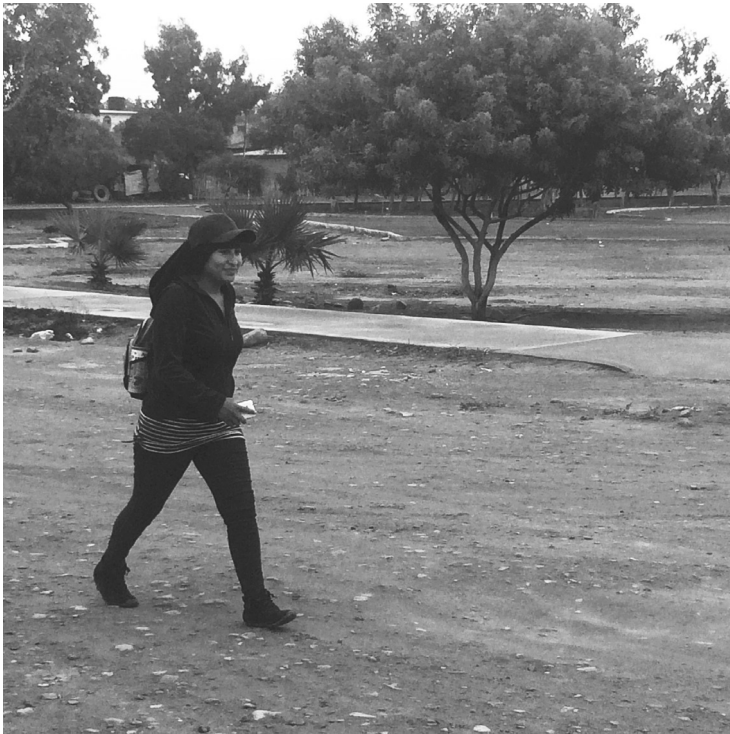
Mujer jornalera.