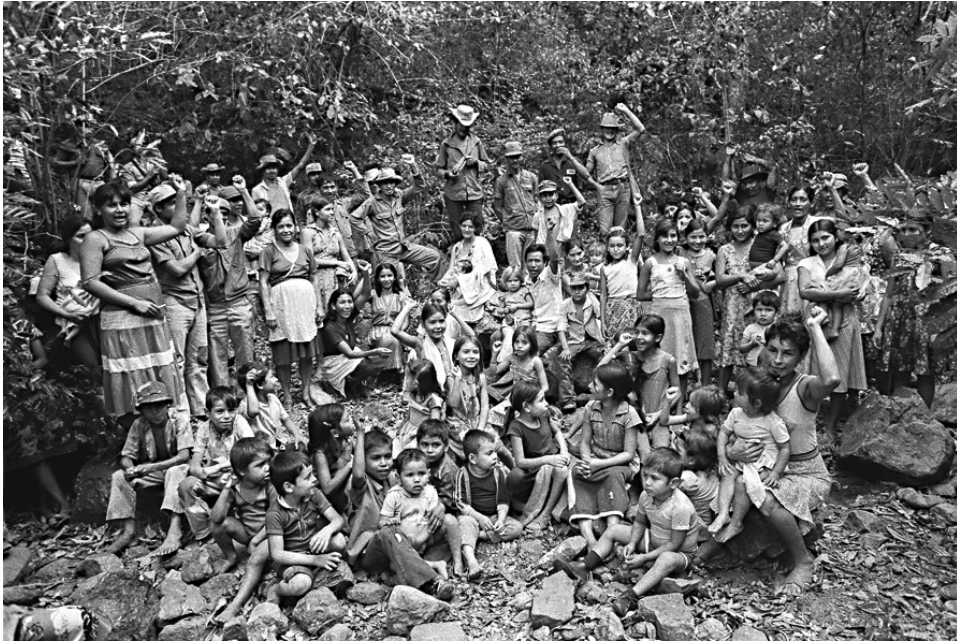
Poder Popular Local, Chalatenango, 1984.