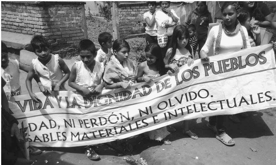
Víctimas de la masacre del Naya en la decimotercera conmemoración de la matanza sosteniendo el letrero: “Vida y Dignidad de los Pueblos. Ni impunidad, ni perdón, ni olvido. Castigo a los responsables materiales e intelectuales”.