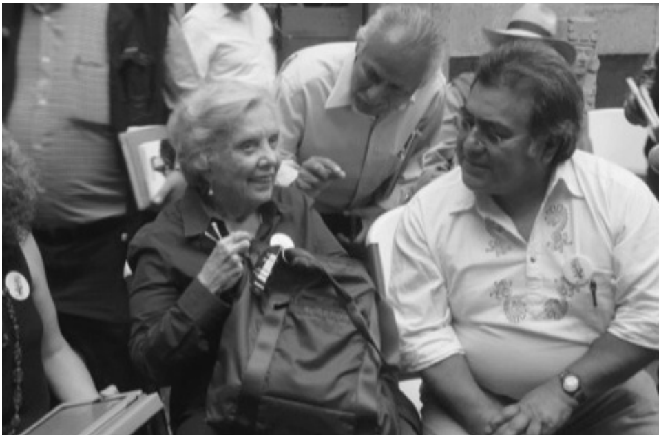
Elena Poniatowska con Cuauthémoc Abarca, en el Museo de la Ciudad de México, en julio de 2015.