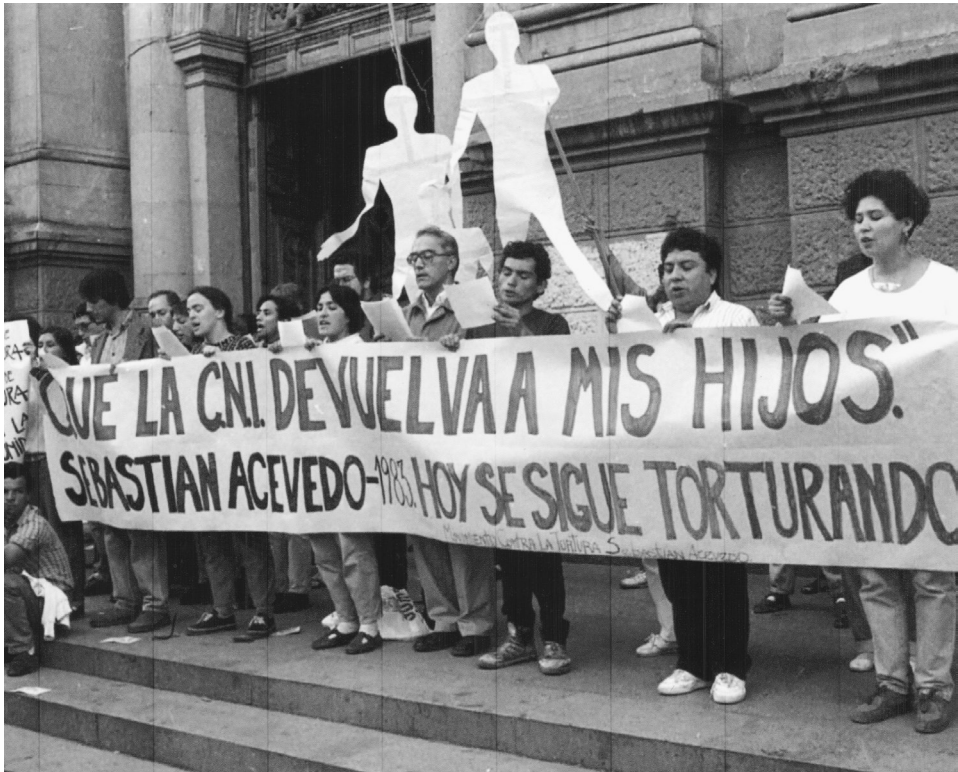
Movimiento Contra la Tortura Sebastián Acevedo.