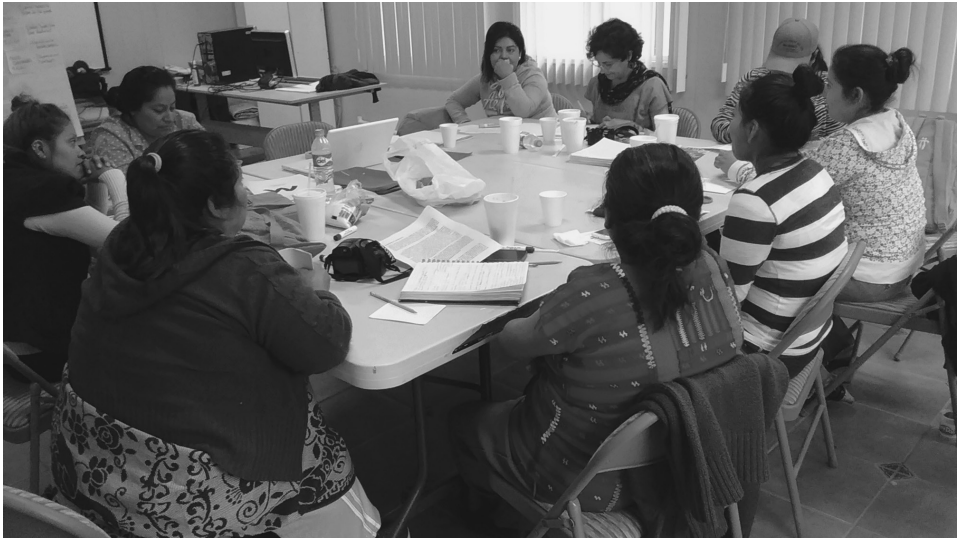
Mujeres en Defensa de la Mujer con la autora.