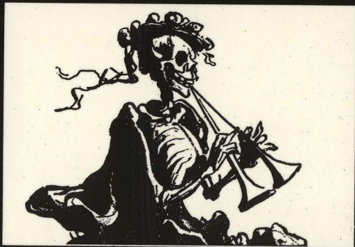
El armisticio, litografía de Daumier.

Licenciado en Sociología (U. de Chile), Maestro en Ciencia Política (FLACSO-CHILE), Master of Letter (U. de Aberdeen, Escocia), Profesor investigador del Departamento de Política y Cultura de la UAM-Xochimilco. Fue coordinador del área de investigación de "Problemas de América Latina".